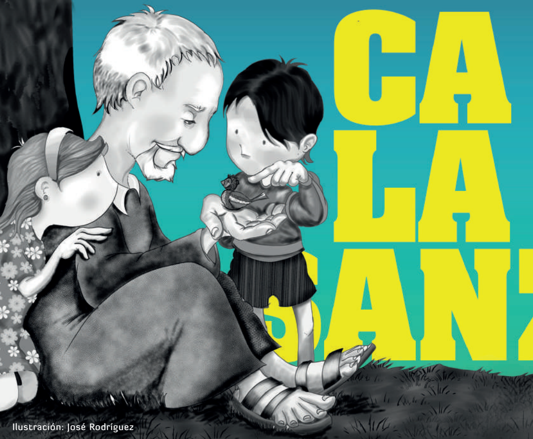
Ilustración: José Rodríguez