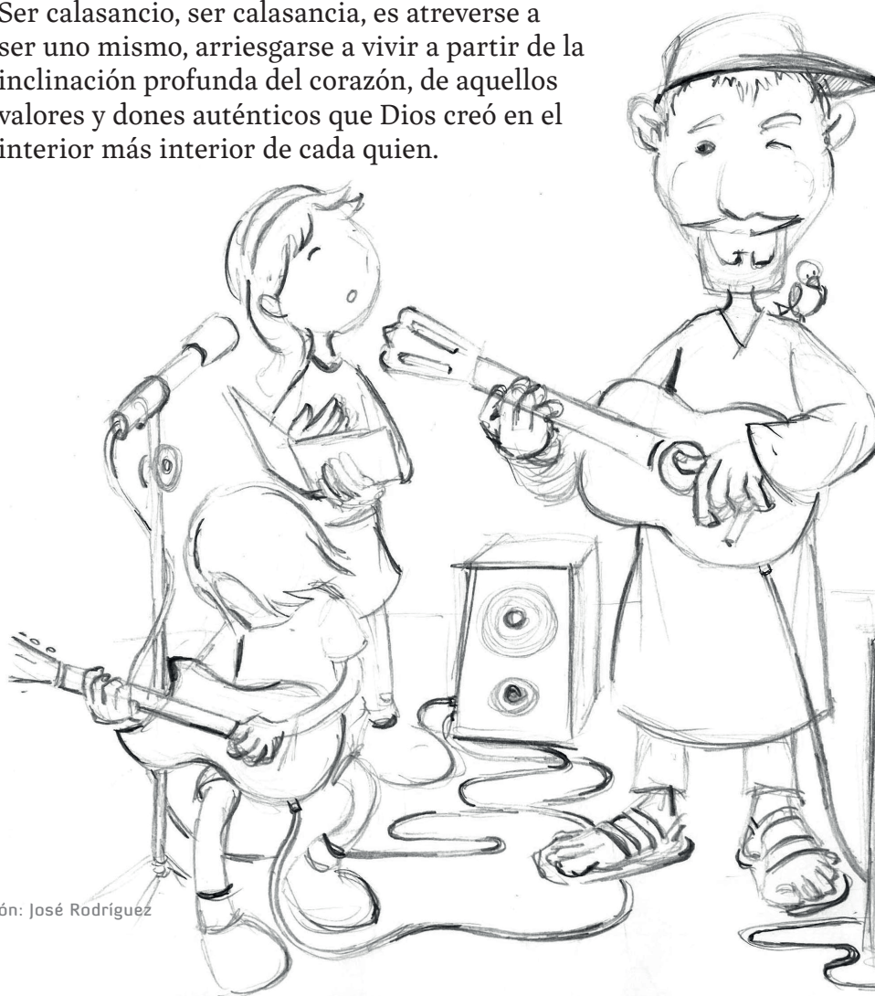
Ilustración: José Rodríguez

Ser calasancio, ser calasancia, es atreverse a ser uno mismo, arriesgarse a vivir a partir de la inclinación profunda del corazón, de aquellos valores y dones auténticos que Dios creó en el interior más interior de cada quien.